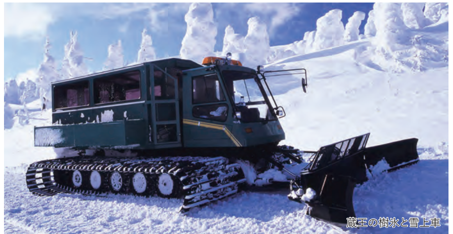
蔵王の樹氷と雪上車