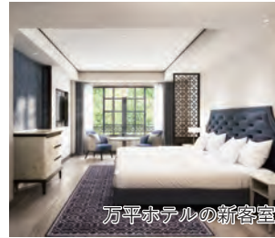
万平ホテルの新客室