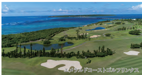
エメラルドコーストゴルフリンクス