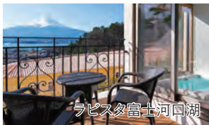
ラビスタ富士河口湖

旅行期間 2025年2月23日(日)～24日(月・祝) 旅行代金 お一人様 218,000円(2名様1室) ※新大阪駅発着以外ご希望の場合は、お問い合わせください。 ※Maison KEIのワインペアリングはソフトドリンクに変更可能 (お一人様6,000円引き) 募集人数 16名(最少催行人数12名) 添乗員 同行いたします 交通機関 JR新幹線【グリーン席・禁煙車】 現地貸切バス(運行バス会社:ドリーム観光) 食事条件 朝1回・昼1回・夕1回 宿泊施設 河口湖/ラビスタ富士河口湖(ラビスタツイン)