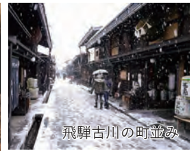
飛騨古川の町並み