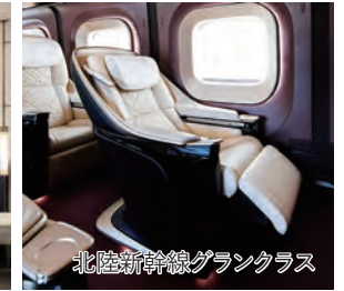
北陸新幹線グランクラス