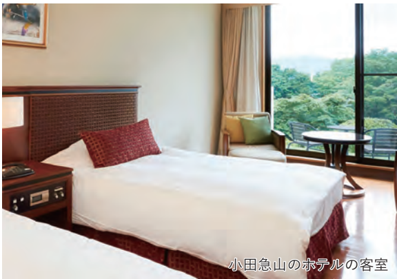
小田急山のホテルの客室