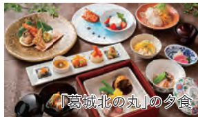
「葛城北の丸」の夕食