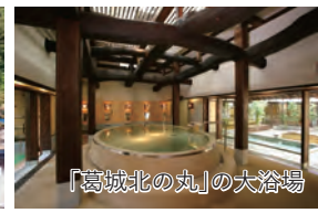
「葛城北の丸」の大浴場