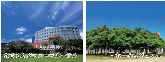
おきえらぶフローラルホテル