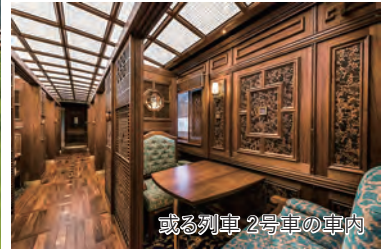
或る列車2号車の車内