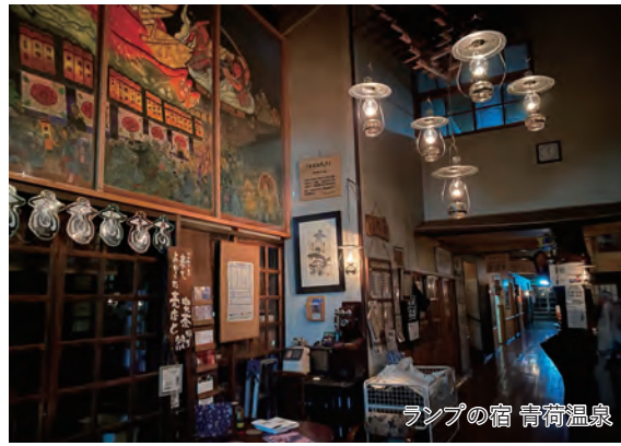
ランプの宿 青荷温泉