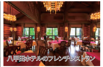
八甲田ホテルのフレンチレストラン