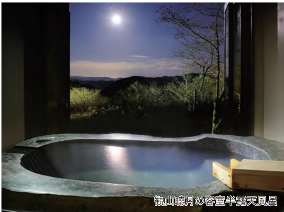
観山聴月の客室半露天風呂