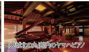
「葛城北の丸」館内のヤマハピアノ