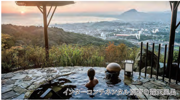
インターコンチネンタル別府の露天風呂