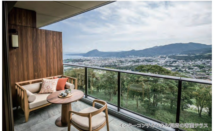
インターコンチネンタル別府の客室テラス