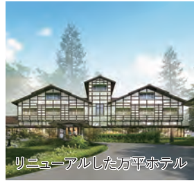
リニューアルした万平ホテル