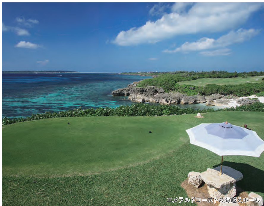
エメラルドコーストの海越えホール