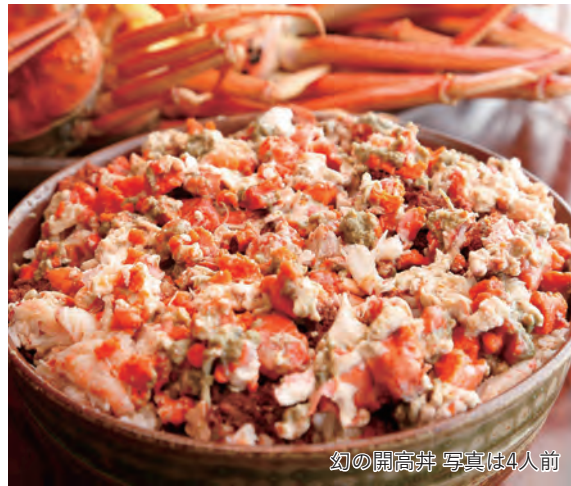
幻の開高丼 写真は4人前