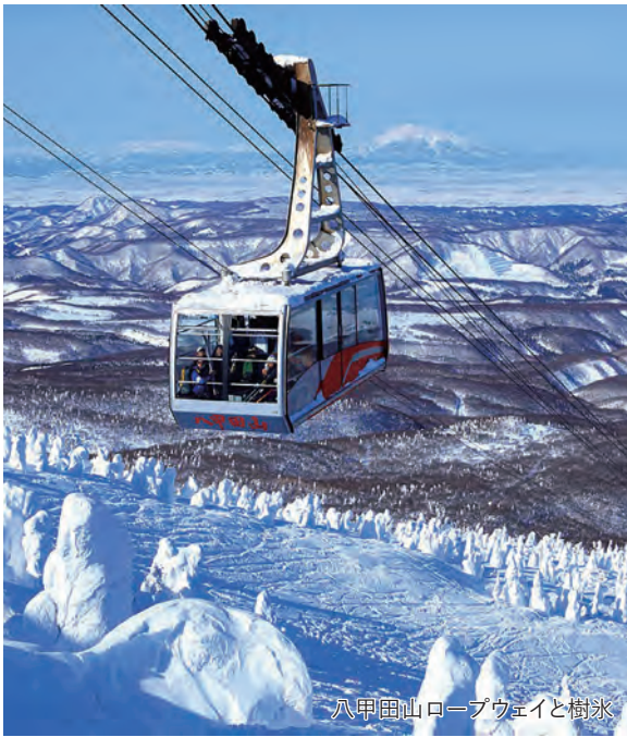
八甲田山ロープウェイと樹氷