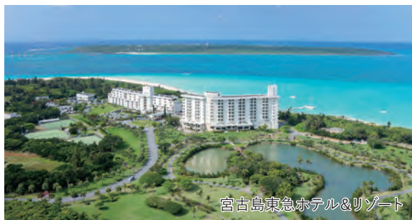
宮古島東急ホテル&リゾート